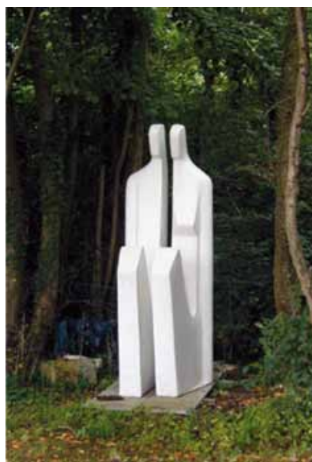
Œuvres de Serge Saint