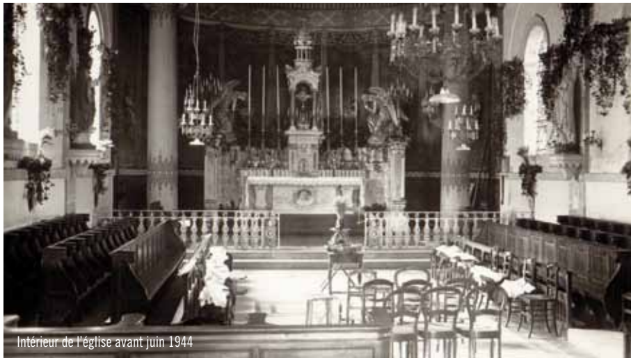
Intérieur de l'église avant juin 1944