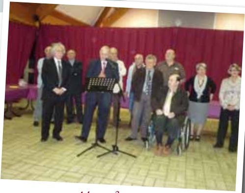
Voeux du Maire