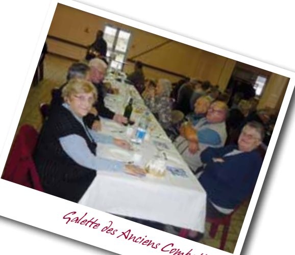
Galette des Anciens Combattants