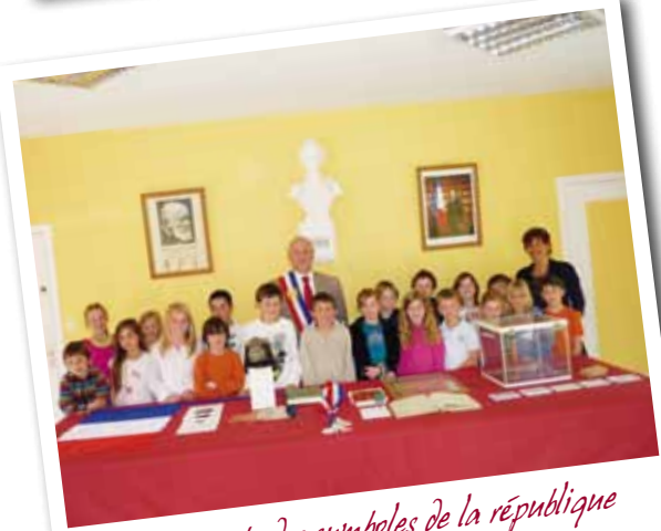
Découverte des symboles de la république