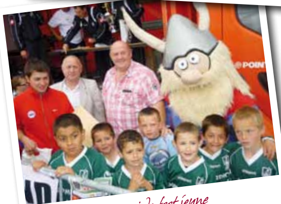
Tournoi de foot jeune