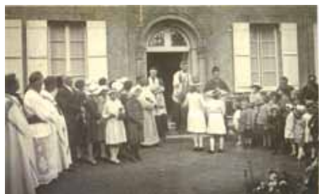
Une visite antérieure de l'Evêque à Thaon

Tout le mois de juin, des obus tombent sur l'église, les allemands cherchant à détruire les clochers qui pourraient servir de poste d'observation. Le dimanche 9 juillet à 15h30, l'Evêque de Bayeux en visite des églises sinistrées, ne bénira que des ruines.