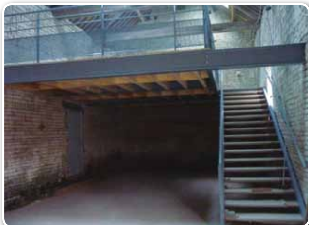
Salle d'exposition : mise en place de la mezzanine

L'école élémentaire méritait de nouveaux portails et portillon, les employés de la commune se sont chargés de leur mise en place avant la rentrée.