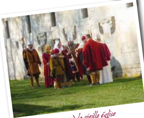
Tournage à la vieille église