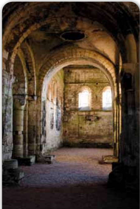
L'intérieur de la vieille église après les travaux de rebouchage d'octobre

Fidèle à la tradition établie depuis 18 ans maintenant, plusieurs bénévoles se sont retrouvés sur le site de la vieille église le 2 avril pour procéder au nettoyage de printemps. Une collation offerte par l'AVET a clos cette noble tradition. Quelques semaines plus tard, le 11ème numéro des Nouvelles de la Vieille Eglise de Thaon a été largement distribué aux donateurs et mis en vente pour les personnes intéressées (2€). Ce numéro contient une synthèse des fouilles archéologiques de la campagne 2010, un article au sujet du cimetière entré en service en 1820, la fondation de la Normandie et du village de Thaon en 911/924 et un article sur François Boitard (1898 / 1959), nom très connu à Thaon.