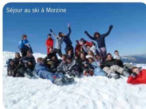
Séjour au ski à Morzine

Un chiffre : 334 jeunes sont venus sur les structures de Thaon et Creully en 2010.