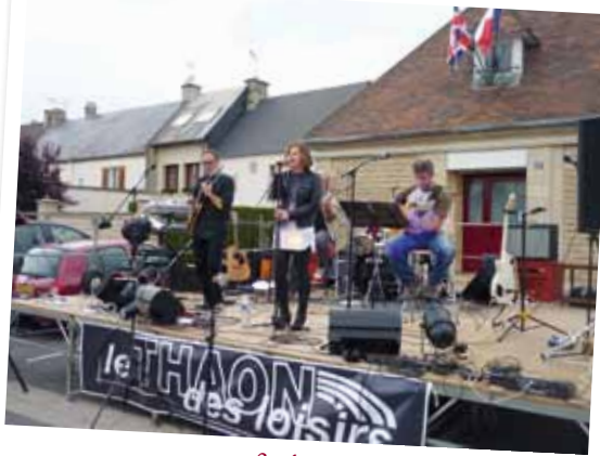
Fête de la musique