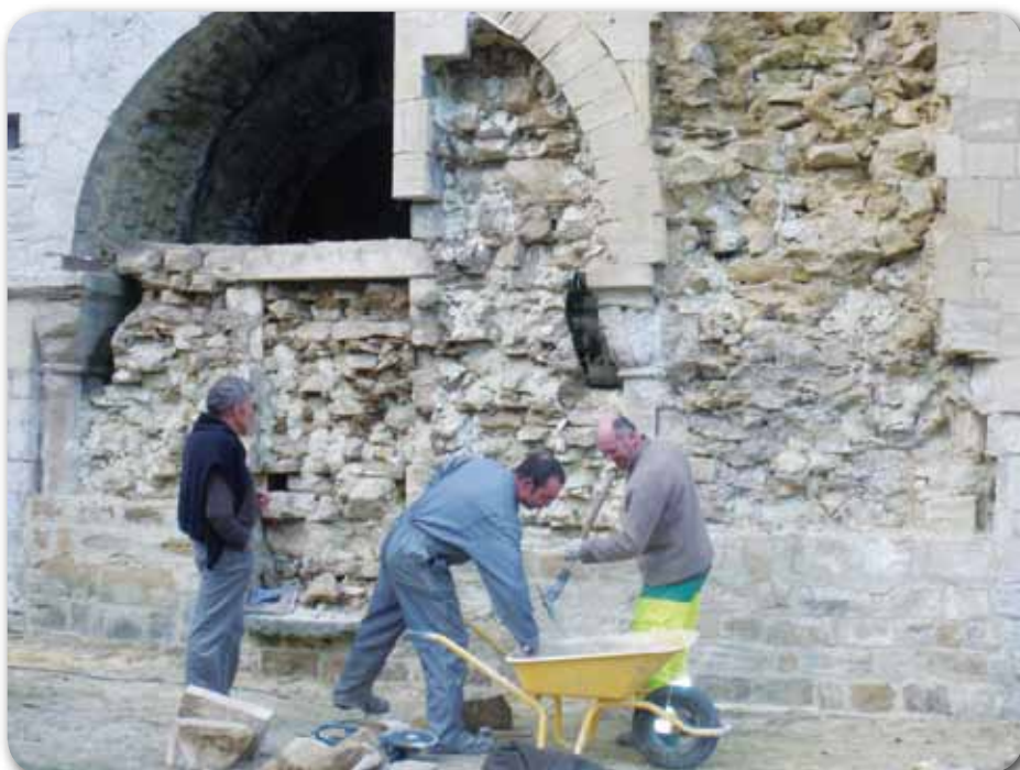
Remise en état de la travée sous clocher par les employés municipaux

Le président, les membres du Conseil d'administration de l'AVET, vous remercient de votre soutien, et présentent à chacun d'entre vous ses vœux les meilleurs pour l'année 2012.