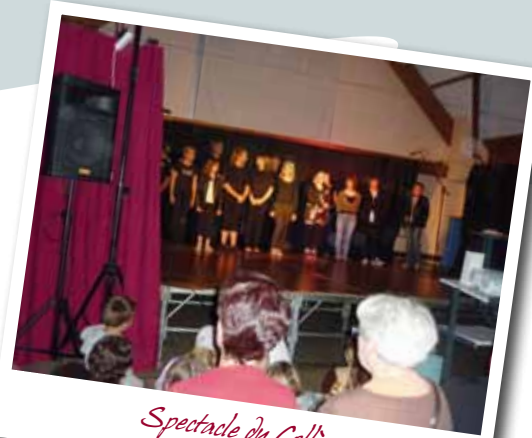
Spectacle du Collège