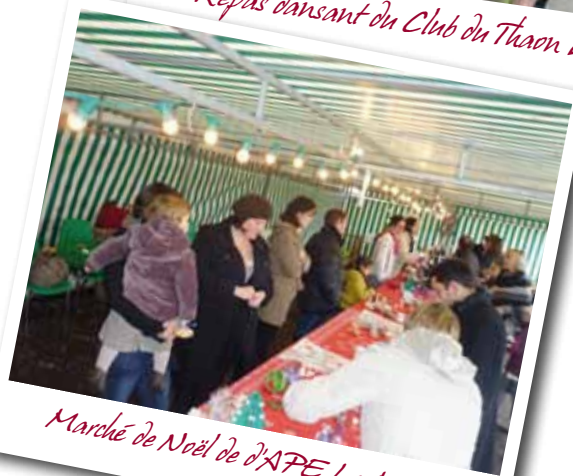
Marché de Noël de d'APE La Marelle