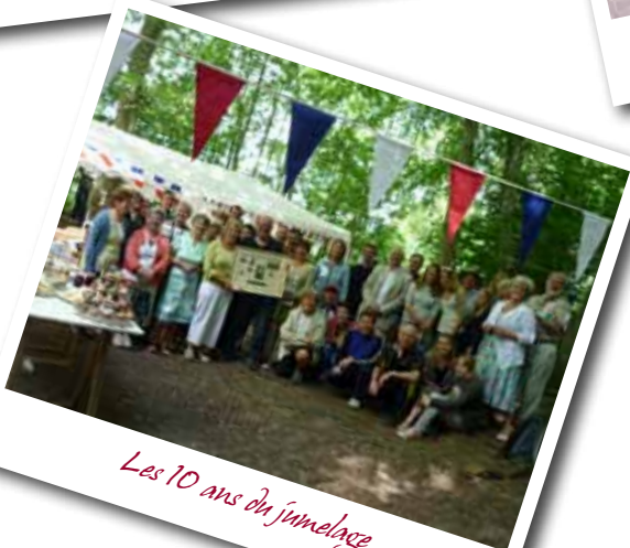
Les 10 ans du jumelage