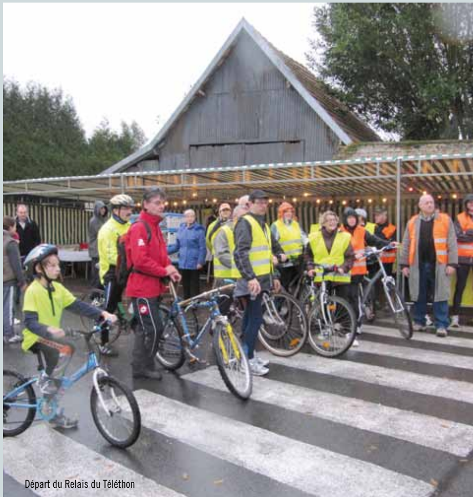
Départ du Relais du Téléthon

Le 9 décembre, à l'occasion du bilan des actions, nous avons totalisé, en fin de journée une somme de 685 €, venue grossir la cagnotte du Creully Téléthon, d'un montant de 7910 €, remise l'A. F. M.