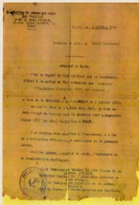
Avis au Maire du décès d'André Liot

13h25 – Transmission à l'Amiral anglais du message de l'Amiral DARLAN : « refus de se plier au dictat britannique, la flotte française appliquera les clauses de l'Armistice avec l'ALLEMAGNE ».