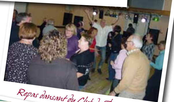
Repas dansant du Club du Thaon Libre