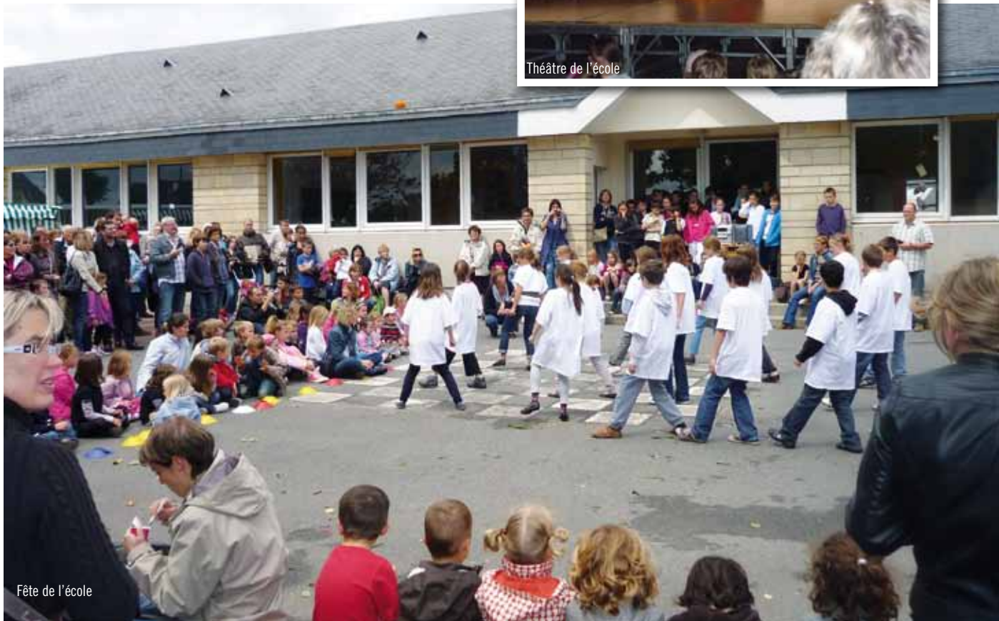
Fête de l'école

L'école primaire de Thaon a accueilli à la rentrée 2011 trois nouvelles enseignantes :