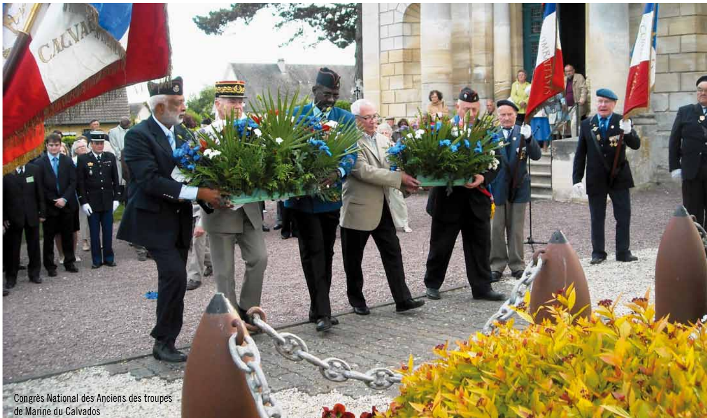
Congrès National des Anciens des troupes de Marine du Calvados