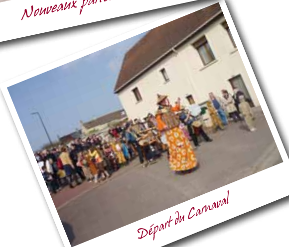
Départ du Carnaval