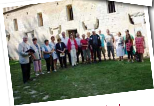
Visite d'été à la vieille église