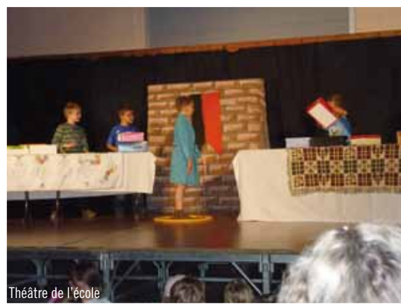
Théâtre de l'école