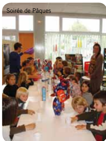
Soirée de Pâques