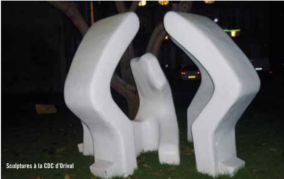
Sculptures à la CDC d'Orival

Serge Saint : vous l'avez sûrement croisé sur votre route, dans vos rues. le marginal, l'ermite, mais c'était aussi notre ami.