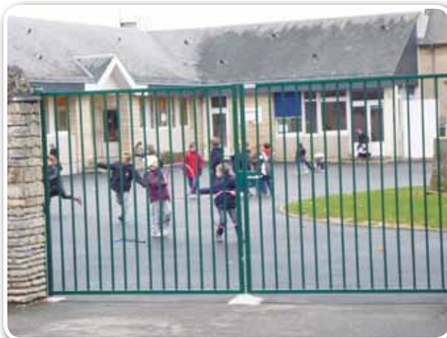
Nouveau portail de l'école élémentaire