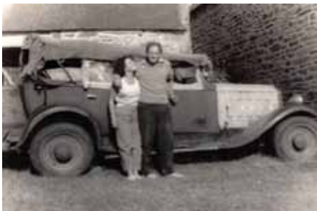
La vaillante C6 et ses propriétaires