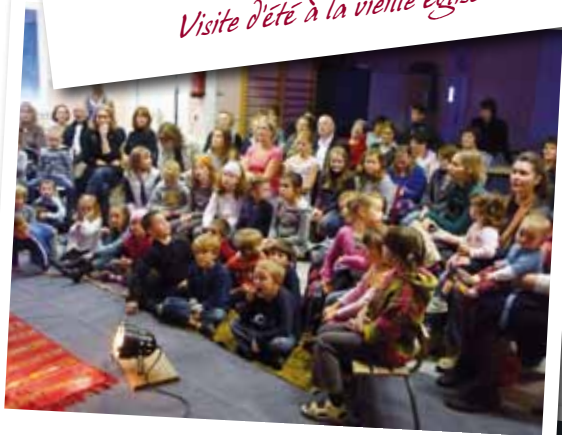
Contes sous un papillon