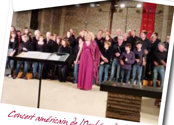
Concert américain de l'Orphéon de Bayeux